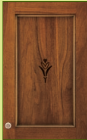
Anta massello, Noce nazionale, spessore 25 mm con incisione. Italian solid walnut door, with inlaid decoration, 25mm in thickness.