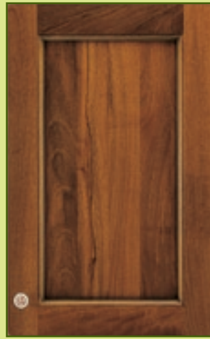
Anta massello, Noce nazionale, spessore 25 mm. Italian solid walnut door, 25mm in thickness.