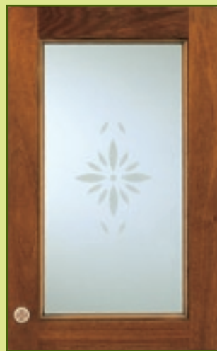
Anta vetro in Noce nazionale, spessore 25 mm. Glass door with national solid walnut frame, 25mm in thickness.